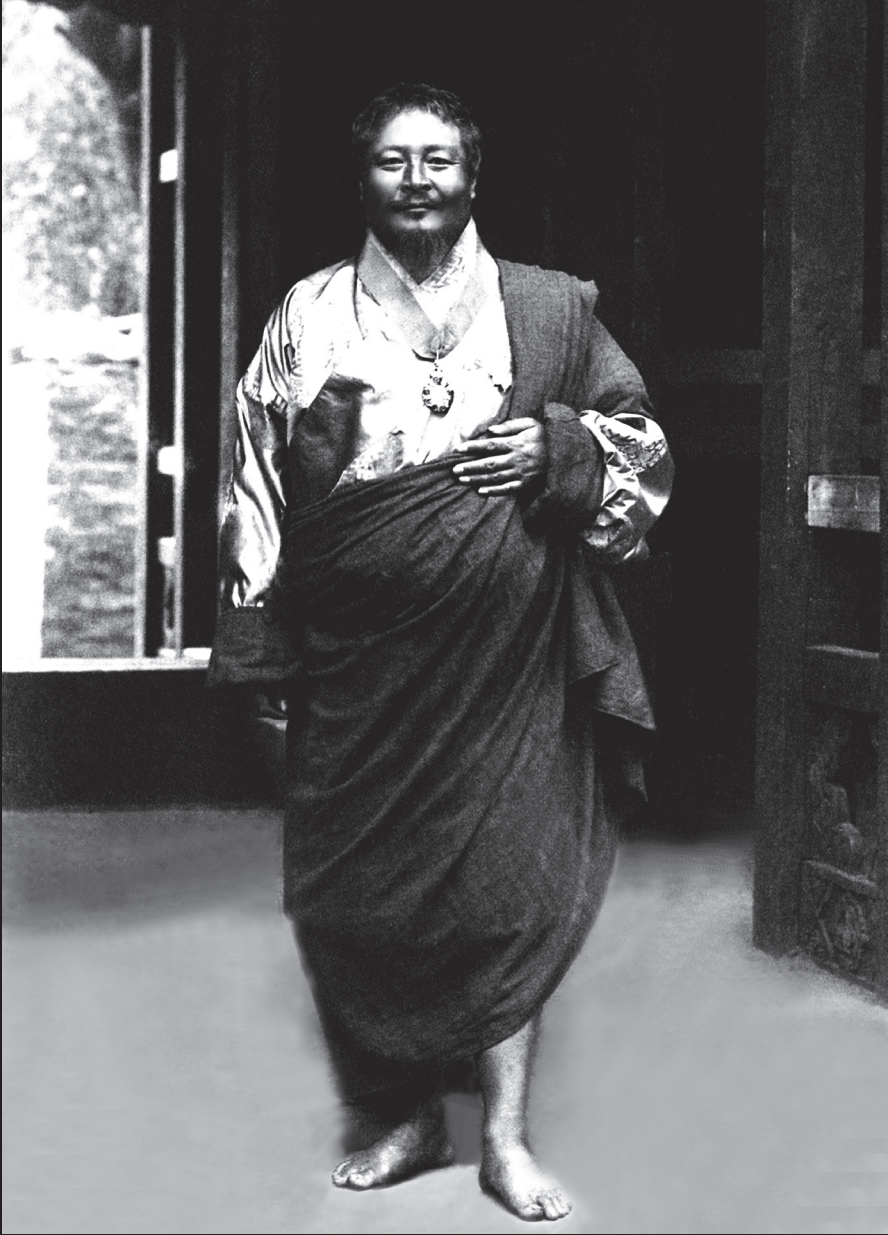
གོང་ས་ཨོ་རྒྱལ་དབང་ཕྱུག་མཚོག།