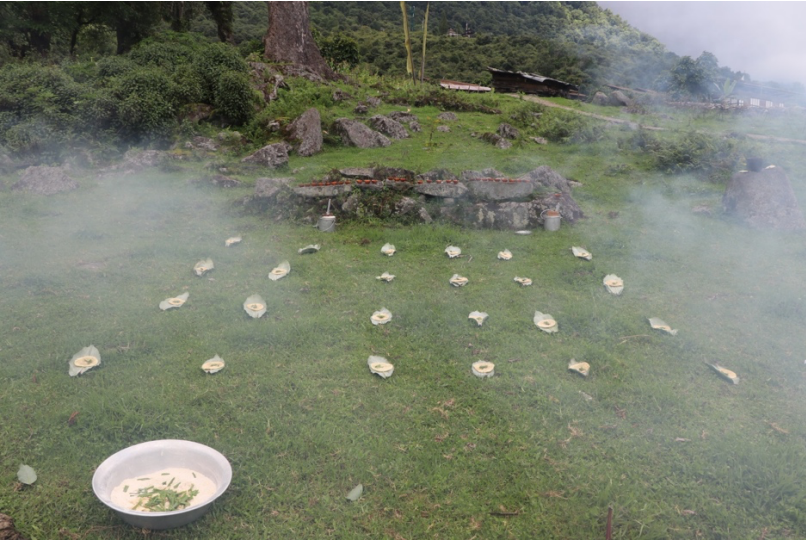
ས་གནས་ཤུ་སྤྱང་ལུ་ཆང་ཕུད་དར་ཚོགས་ཕུལ་བའི་མཐོང་སྤྱང་།

དར་ཚེལ་རྩོམ་མ། རྒྱ་སྒོ་གཤམ་གི་འདབ་མ་ མ་གཏོགས་ གཞན་ འོ་ཕུད། མར་ཕུད། དང་ དར་ ཤིང་འཕྱར་བའི་སྲོལ་མིན་འདུག། སྤྲོན་མོ་སྤྱང་ལུ་བཟུམ་སྤྱེ་འགྲམ་ནག་དཔའ་བོ་ལུ་ཆང་ཕུད་ སྤྱང་ཆང་ལྷོ་བཞེངས་ནང་བཀའ་སྤྱོ་སོ་སོར་འབད་ཕུལ་མ་ཨིན་པས།