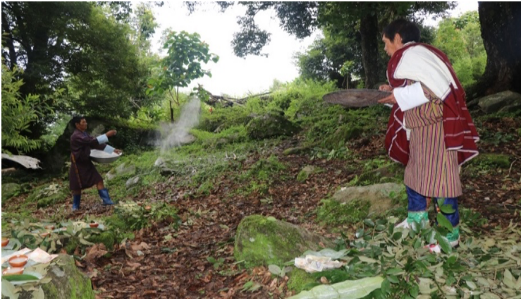
གནས་བདག། གཞི་བདག་ཚུ་ལུ་ཚོགས་སུལ་བའི་མཐོང་སྐྱང་།

གནས་རེ་གནས་ཚོན་ ས་ཁར་གནས་རེ་གནས་ཚོན་ ཡོད་ཚོད་པ་གཅིག་གི་མིང་བཏོན་ཏེ་ གུང་ མི7་ དང་སློབ་མ་ཟེར་ཚོགས་ཀྱི་མཚོན་པ་སུལ་ཏེ་ ག་དེ་ཅིག་བཞེས་ཚུགས་ཚུགས་པ་བཞེས་སྐྱ་ རེ་ཟེར་ ད་རིས་བཏབ་པའི་ལོ་ཐོག་ལུ་གཞོན་པ་རྒྱབ་མ་བཅུག། རི་དྲགས་སེམས་ཅན་གྱི་གཞོན་ པ་ཚུ་འབྲུང་མ་བཅུག་ཟེར་སློན་ལམ་བཏབ་སྟེ་སྐྱབས་འཚོལ་མ་ཡིན་པས། མཚུགས་ གསོལ་ མཚོན་དེ་ཡང་ དུས་ལུན་ཚུ་ཚོན་ཞུ་ གི་རིང་ལུ་གསོལ་མཚོན་སུལ་ཚར་མ་ཡིན་པས། སློན་མ་ འབད་བ་ཅིན་ ལྷ་གསོལ་བའི་དུས་ཚོད་དེ་ཡང་ བོན་པོ་གིས་ཉི་མའི་འོད་ཟེར་དང་འབྲན་འབྲ་ ལྷ་ འོ་དེ་གུང་རྒྱལ་ལྷོ་དོ་ཡོད་པ་ཡིན་ཅུང་ ད་རིས་ནངས་བ་དེའི་སློལ་ཉམས་ཏེ་ རྩོ་པ་ཚུ་ཚོན་དགུ་དེ་ ཅིག་ལུ་གསོལ་མཚོན་སུལ་ཚར་དོ་ཡོད་པ་ཡིན་པས།