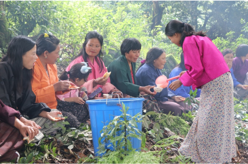
འདི་ཁར་འཛོམས་པའི་མི་སེར་རྩུ་ལྷ་སྤང་ཆང་དང་ཀེབ་ཏར་དངས་ཆར་མཚོང་སྤང་།

དེལས་ དེལར་འཛོམས་མི་ མི་སེར་མོ་མོ་དང་ལྷ་ཡི་རྩ་བ་རྩུ་གིས་སྤྲོད་དེ་སྤྲོད་ཏེ་སྤོན་ལམ་ བཏབ་ནི་དང་ དེལས་མེབས་ཆང་ཟེར་མར་ཆང་དངས་ཆར་བའི་ཤུག་ལྷ་ མི་སེར་རྩུ་ལམ་ སྤང་ཆང་དང་ཀེབ་ཏར་རྩུ་བྱིན་ཏེ་ བྱག་ལྷ་ 6 ཟེར་མོས་བཟང་དན་བལྟ་མ་ཡིན་པས།