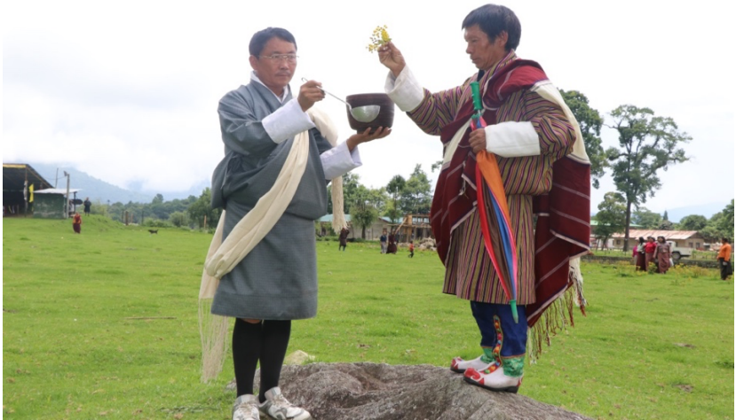
ལྷ་འི་རྩ་བ་བོན་པོའི་ཞབས་སར་འོང་བའི་མཐོང་སྤྲང་།

སྤྲུལ་མ་བྲང་ལུ་ལྷ་གསོལ་ཏེ་ བོན་པོ་གཡུས་གྱི་སྤྲང་བར་ཐང་ནང་ཐེབས་ད་ ལྷ་འི་རྩ་བ་གིས་སྤྲང་ ཆང་སྟོགས་བཞེདས་གཅིག་འབག་སྟེ་ བོན་པོའི་ཞབས་སར་བཅར་མ་ཞིན་པས། དེ་ཁར་བོན་པོ་ གིས་བྱུགས་སྟོན་གནད་སྟེ་ཆང་ཐོར་པ་གང་བཞེས་བཞིན་ན་ ལྷ་གསོལ་སའི་ལྷ་སྤྲང་ནང་འགྲོ་སྟེ་ ཤིང་གི་ཤོམ་འདབ་འཐིང་ཡོད་པའི་བཞུགས་གདན་གྱུར་སྟོན་དེ་ ལྷ་ཞུ་ནི་དང་གསོལ་མཚན་ རིམ་པ་རྩེ་གར་ཤོང་སྤྲུལ་མོ་སྤྲང་དང་རྩེ་གར་སེང་ལ་ལུ་འབད་དོ་བཟུམ་སྟེ་ཅོག་འཐད་པ་ཞིན་རུང་ ལུ་སྤྲང་འདི་མི་མང་གི་ལྷ་སྤྲང་འབད་མ་ལས་གུང་པ་ལེ་རེ་བཞིན་དུ་གི་མོ་བཟང་ངན་བཟླ་མ་ཞིན་ པས།