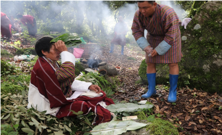
བོན་པོ་གིས་ཕྱག་ལུ་བལྟ་བའི་མཐོང་སྣང་།

དེ་ལས་མོ་བཟང་ངན་བལྟ་ཚར་བའི་ཤུལ་ལུ་ བོན་པོ་གིས་ཀྱ་ཅུང་ནང་ཚུ་སྤྱད་སྲུགས་ཏེ་ ལྷ་ལོག་ སྟེ་ཡར་ནམ་མཁའ་ ལམ་སྤུ་གི་སྤྱང་ཚིག་འདོན་ཏེ་གདན་འདྲེན་ལྷ་སྟེ་ཀམ་གཡུ་ཡི་གདན་དུ་ ཟེར་བའི་ཚིག་གྲར་ལྟོད་པ་གཅིག་ བོན་པོ་གིས་རྒྱ་སྤྱོད་སྤྱིན་པའི་བདག་པོ་གིས་